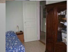
Schlafzimmer 2 Betten für 1 Person