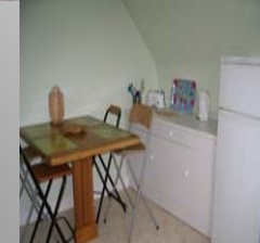
Küche mit Essecke