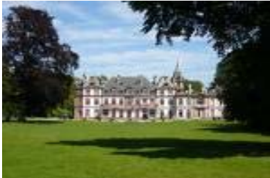
Le château De Pourtalès