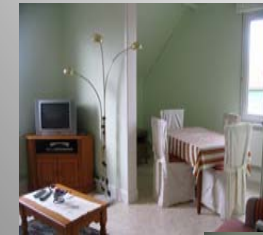
Wohnzimmer mit Essecke