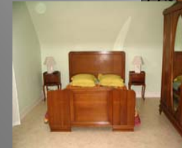
Schlafzimmer 1 Bett für 2 Personen